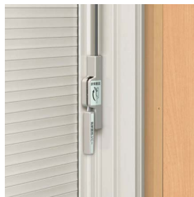
シャッター h ≥ 1,330mm