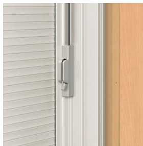
シャッター h < 1,330mm