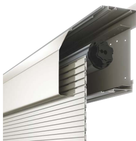
モーターロック機構

※シャッターを開閉する際は、手動錠が解錠されていることを確認してから行ってください。 ※土間用には手動錠は装備していません。