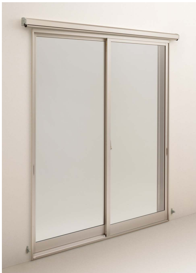
■アウターシェードなしの場合